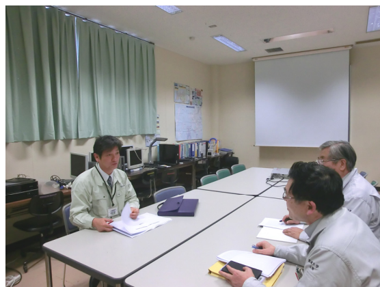
ニーズ調査の様子