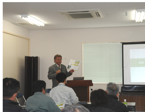
講義:道路・斜面・トンネルについて(諫早会場)

講師を担当してくださいました道守認定者の皆さま、ご協力ありがとうございました。他にも手を挙げて頂いた方がいらっしゃいましたが、今回は先着順とさせていただきます。また次の機会にお願いします!