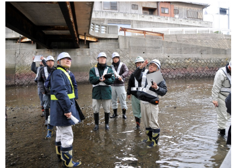
現場実習(鋼構造)状況

11月22日(金)より毎週金曜日5週に亘り、道守補コースを開講しました。11名が講義、演習、現場実習を受講して、1月17日(金)に認定試験を受験されました。今までは民間企業が主な受講者でしたが、各方面からの声により今年度は自治体職員を中心に開催しました。みなさん熱心に講義や実習に参加され、特に点検演習や現場実習では積極的に質問して大変意欲的だったのが印象的でした。今後さらに特定道守、道守とステップアップし、土木行政の頼もしい存在となることが期待されます。