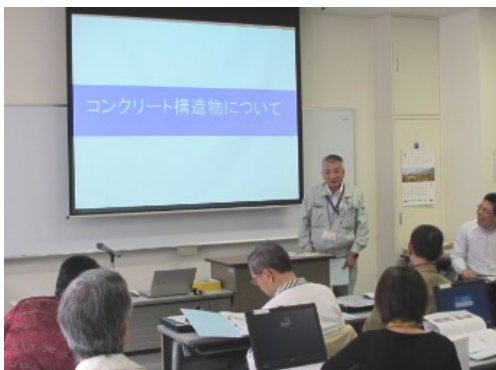
講義:コンクリート構造物について(放送大学)